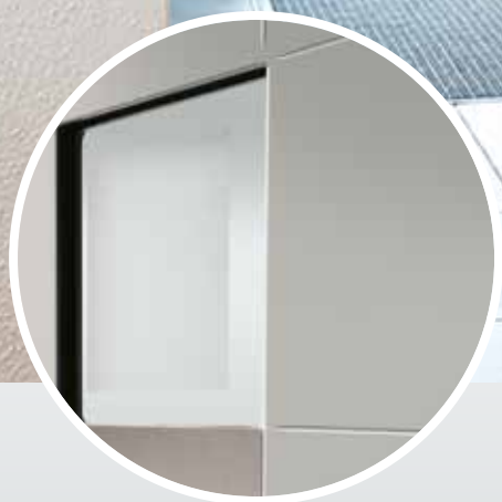
Designsandstrahlglas Y 561 Float (Außenansicht)